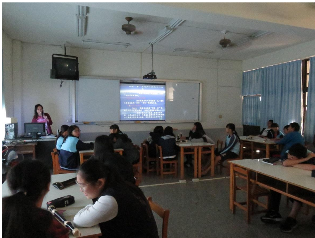
文字說明: 家庭教育對個人的重要性