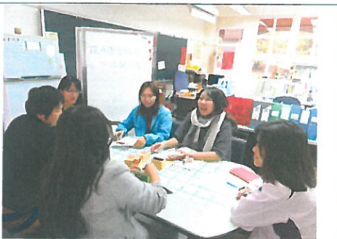
編號：06 日期：11/16 提升學習成效經驗分享