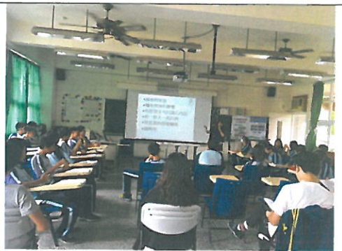
編號：04 日期：9/21 教學觀課議課