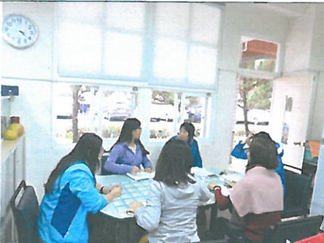
編號：05 日期：10/26 教 學觀課議課