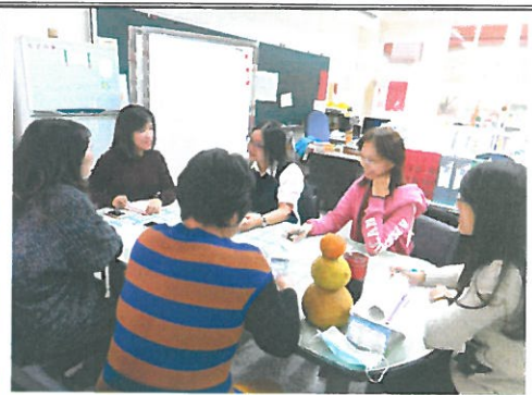
編號：02 日期：4/20 學思達主題經驗分享