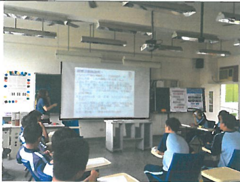
編號：03 日期：5/18 學思達教學策略與教材演練