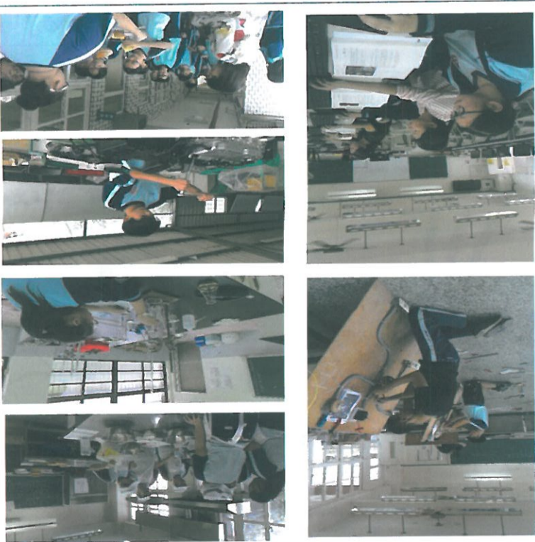
各職群選手練習情形 及食品群成果分享